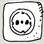
stekkers uit stopcontact